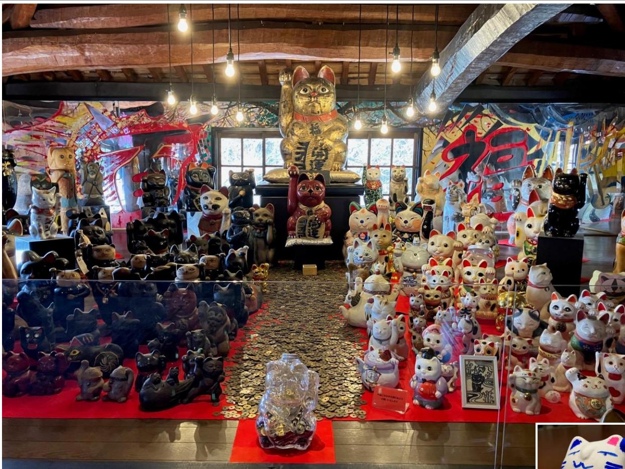
撮影場所：岡山市 北区

コメント：「福の殿堂」を称する招き猫の展示館が岡山市の山あいにあります。古民家を改築して1994年に個人の方が開館されました。絵付け体験があり1時間程でできるといふことで私も挑戦しました。デザインは広島出身者の定番です。愛くるしい表情をご覧ください。