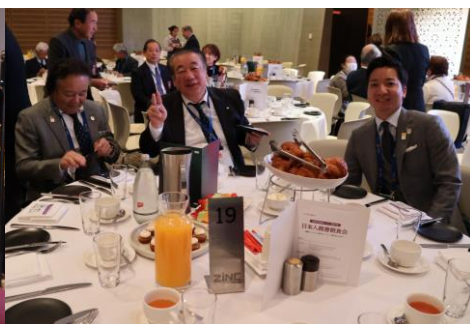
日本人親善朝食会