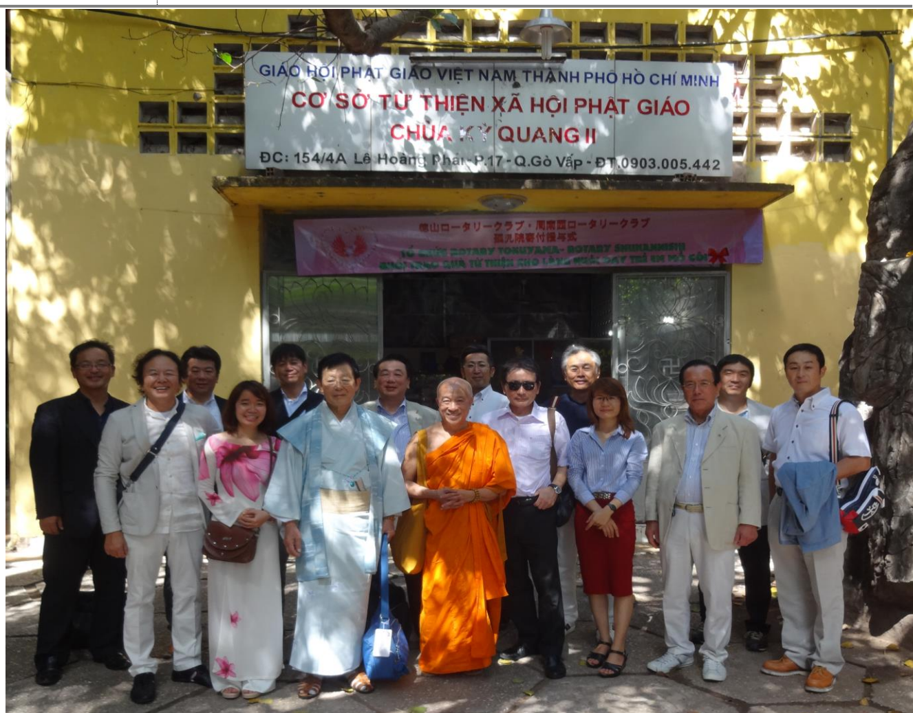
11月18日「ベトナム南部の孤児養護施設への寄付事業」贈呈式