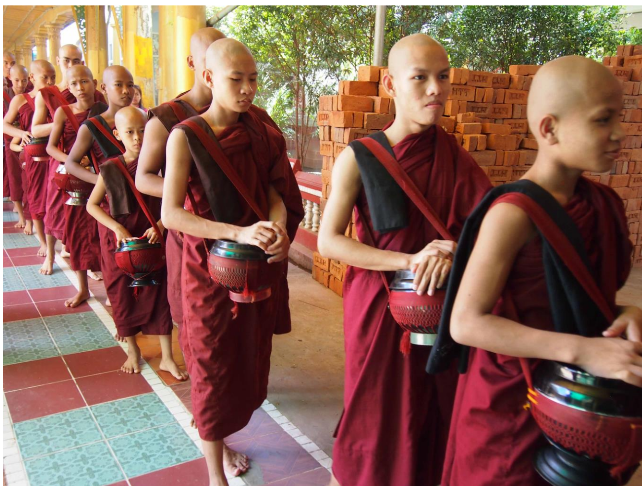
撮影場所：ミャンマーバゴー チャッカワイン僧院 コメント：ミャンマー屈指の僧院で、1000人もの若い僧侶が修業に励んでいる。